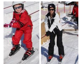
2 talentierte Skianfänger

Privatskilehrer für Fortgeschrittene können wir ebenfalls buchen. Je nach Anzahl der Teilnehmer errechnet sich der Kurspreis. Sprechen Sie uns bei Bedarf an!